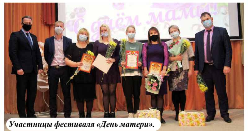
Участницы фестиваля «День матери».

России, утверждению духовных ценностей, семейных традиций, душевное тепло в семье, яркий пример для подражания в формировании нравственной семейной политики в районе».